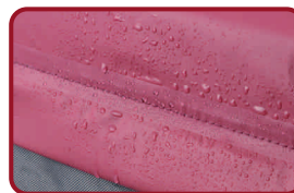
Funda impermeable al agua

*Los defectos o desperfectos debidos a una incorrecta utilización o manipulación del material o los desgastes producidos por un uso normal del mismo, no se incluyen en esta garantía.