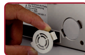
Filtro de aire